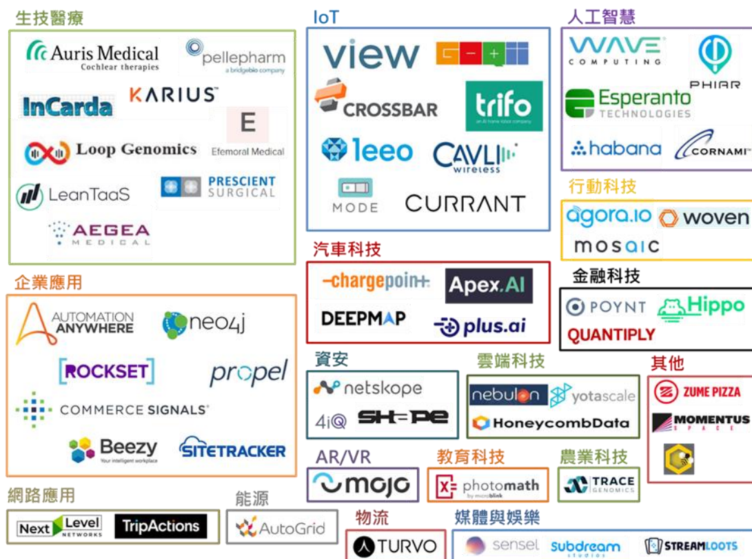
圖 1-3、2018 年 11 月矽谷地區早期投資領域地圖